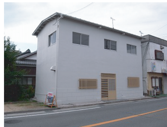
※写真は東側から撮影されたものです。