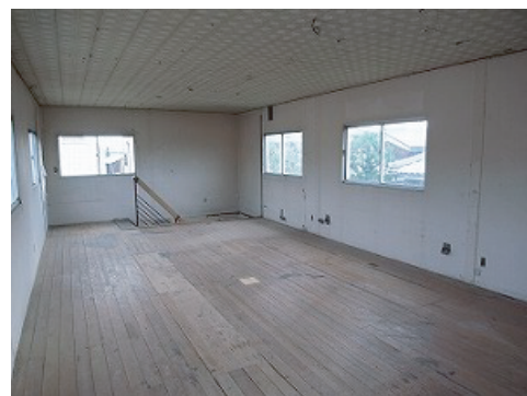
現況と図面が異なる場合は現況を優先します。