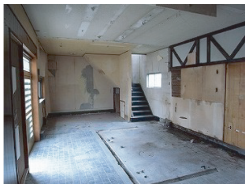
※1Fの内部はトイレ以外撤去しています。