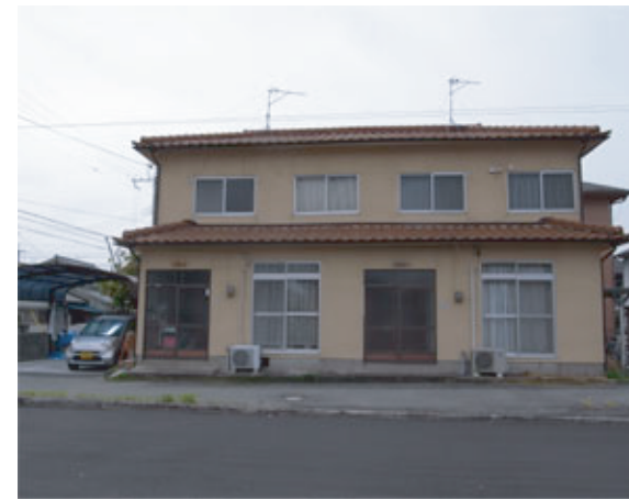
※写真は東側から撮影されたものです。