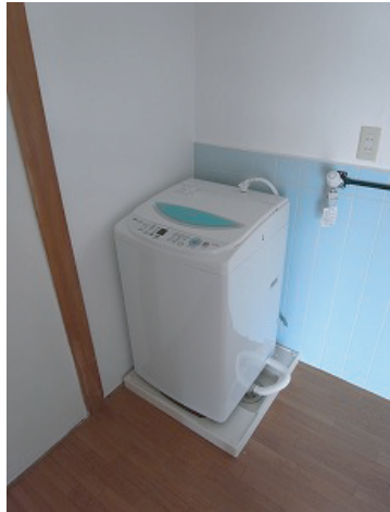
※洗濯機が標準でついています。