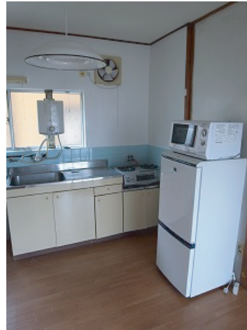
※冷蔵庫、電子レンジ、ガスコンロが標準でついています。